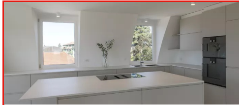
Transformation d'un appartement en duplex Wohnen, Pully