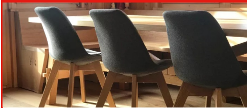
Chalet Grächen Wohnen, Grächen