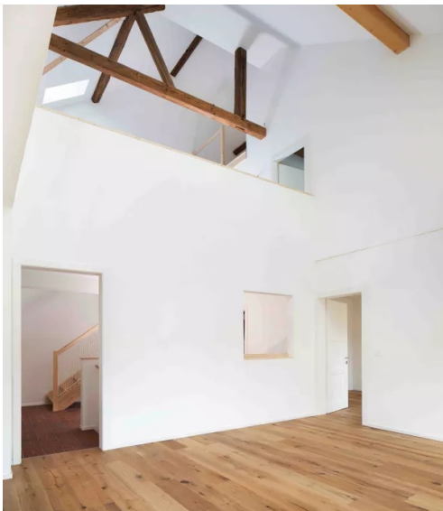
transformation de l'appartement existant

Transformation d'une maison des années 50 avec un rural, création de 3 logements dans le volume existant.