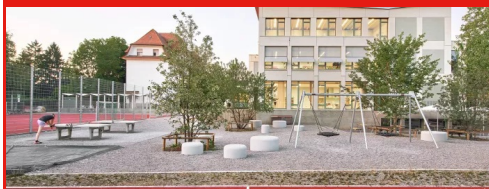
Aemtler D Unterricht, Bildung und Forschung, Zürich