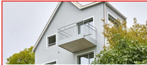
Haus G Wohnen, Kilchberg