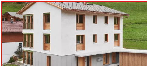
Ortolfi Wohnen, Davos