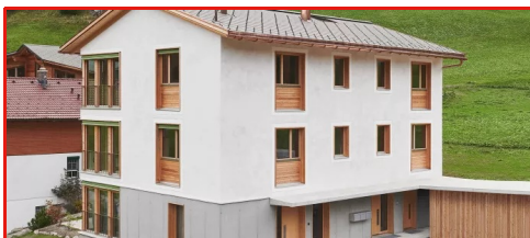
Ortolfi Habitation, Davos