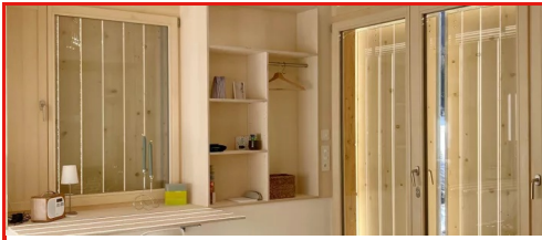
Schluochthus Abitazione, Davos