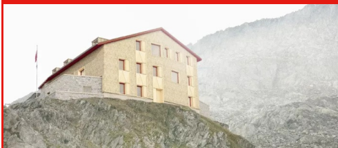
Camona da Cavardiras Settore alberghiero e turismo - Sport e tempo libero, Cavardiras